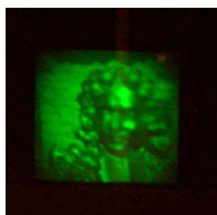
Hologramme réalisé Au Laboratoire de l'ADATH