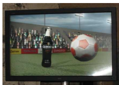
Télé en relief – Procédé Alioscopy