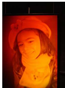
Portrait en couleur